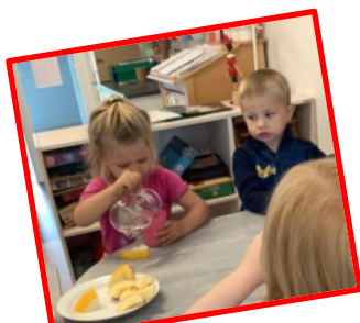
Vi øver os – vi kan selv

Maden serveres kl. 16.00. Der tilbydes brød og grønt/frugt.