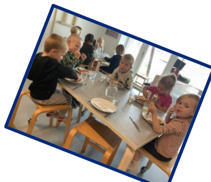
Vi har et socialt fællesskab omkring måltidet