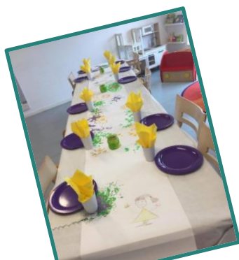
Vi dækker sammen et flot bord ved højtider og traditioner